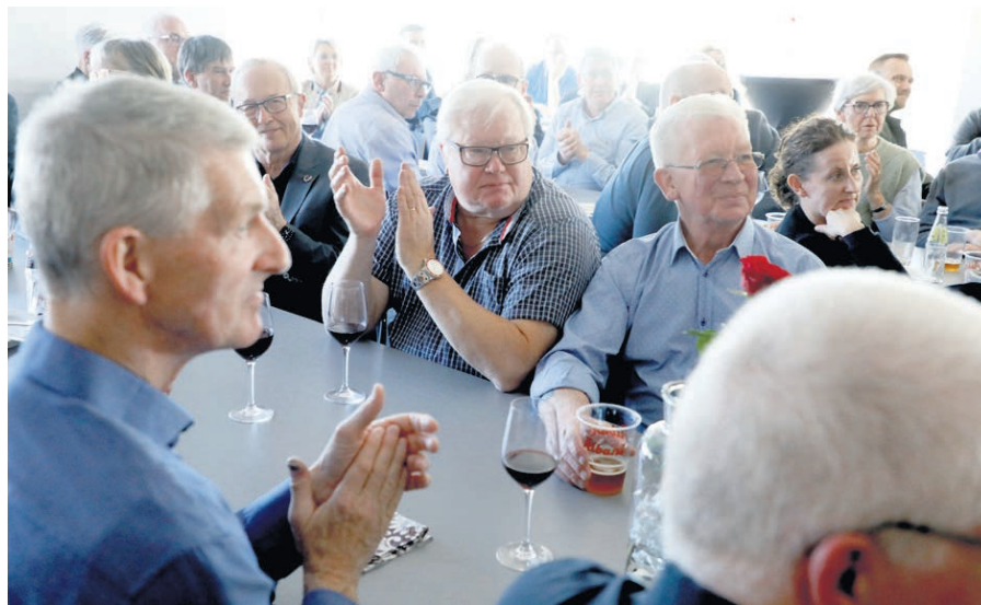
Op mod halvandet hundrede mennesker var mødt op til indvielsen af Idrætscenter Sunds Vest, som nu er stort set færdigt.